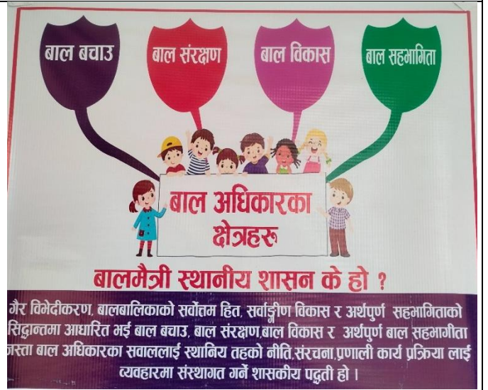
सार्वजनिक स्थलमा टाँस गरिएको बालअधिकारको क्षेत्रहरु उल्लेखित सूचना ।