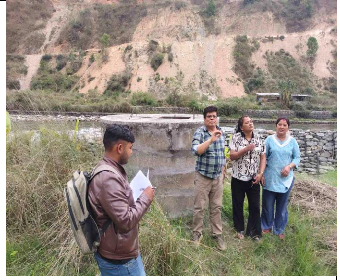
वडा नं ३ मा संचालन भएको साँघुटार थाक्लेवेशी लिफ्ट खानेपानी योजना सामाजिक प्रभावको विषयमा छलफल गर्दै ।