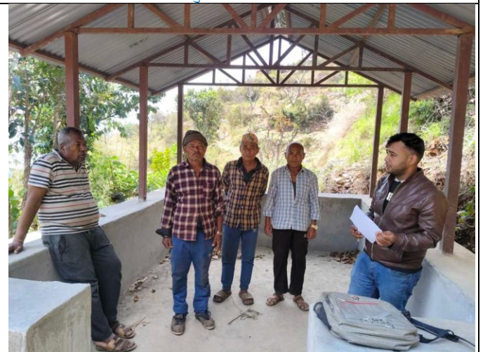
वडा नं ९ मा निर्माण गरिएको टूस भवन निर्माण योजनाको सामाजिक प्रभावको विषयमा छलफल गर्दै ।