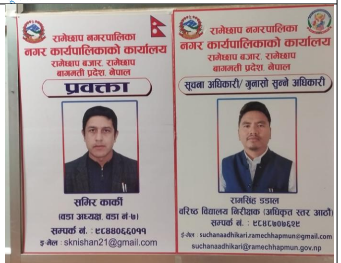
नगरपालिका परिसरमा राखिएको प्रवक्ता र सूचना/गुनासो सुन्ने अधिकारीको फोटो सहितको विवरण ।