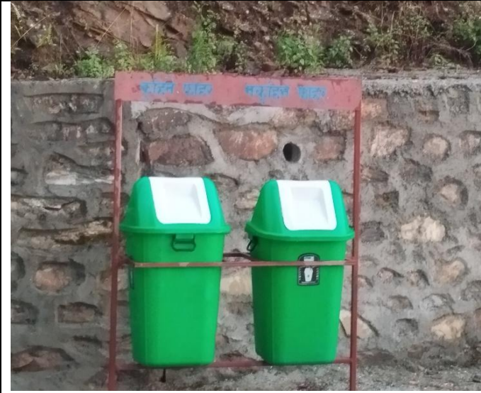
सार्वजनिक स्थलमा राखिएको डस्टवीन ।