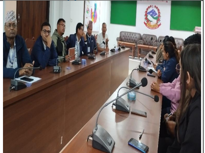
सामाजिक परीक्षणको प्रारम्भीक नतिजा सार्वजनिकीकरणका सहभागिहरु ।