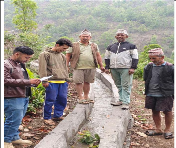
वडा नं १ को भारलांगे सिचाई कुलो मर्मत तथा टयाङ्गी मर्मत योजनाको सामाजिक प्रभावको विषयमा छलफल गर्दै ।