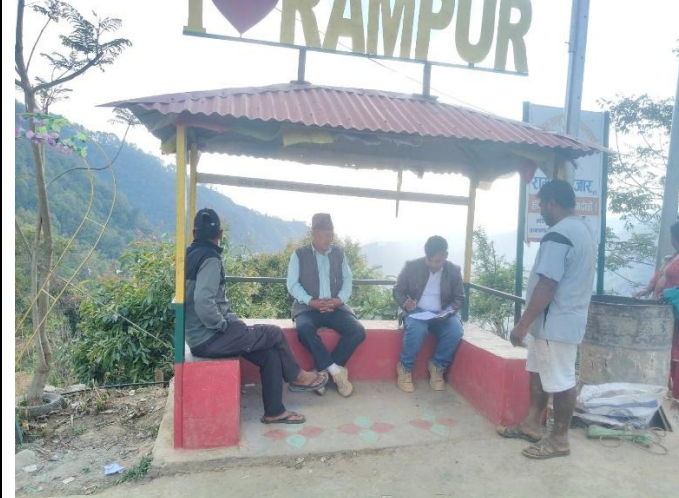
वडा नं ५ मा निर्माण गरिएको रामपुर वडा कार्यालय जाने सडक ढलान योजनाको सामाजिक प्रभावको विषयमा छलफल गर्दै फिल्ड सहजकर्ता ।