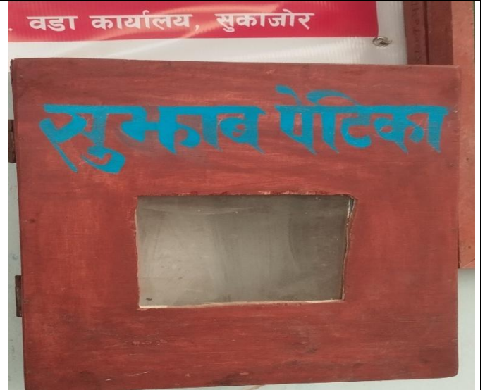
वडा नं ७ को कार्यालयमा राखिएको सुभाब पेटिका ।