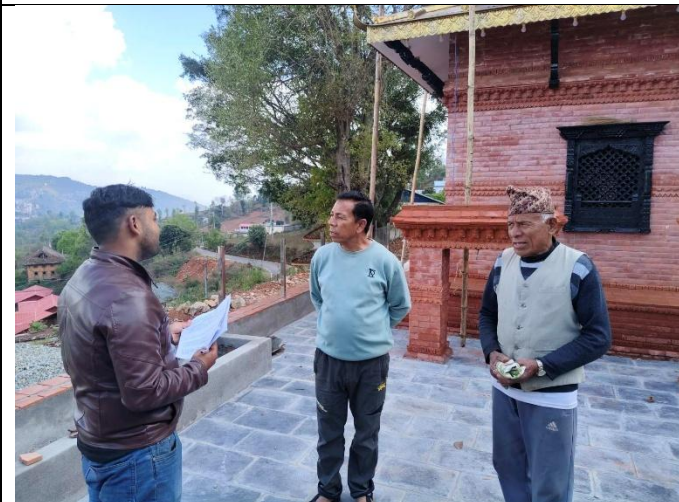
वडा नं ८ मा निर्माण गरिएको कृष्ण मन्दिर निर्माण योजनाको सामाजिक प्रभावको विषयमा छलफल गर्दै फिल्ड सहजकर्ता ।