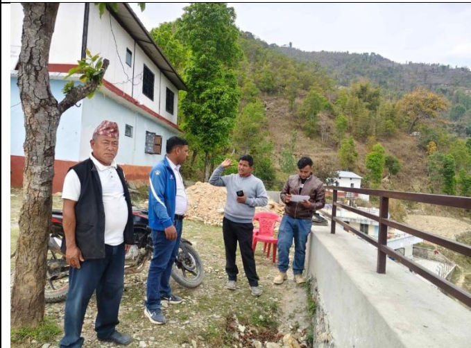
वडा नं २ को वडा कार्यालय व्यवस्थापन अन्तर्गत योजनाको सामाजिक प्रभावको विषयमा छलफल गर्दै ।