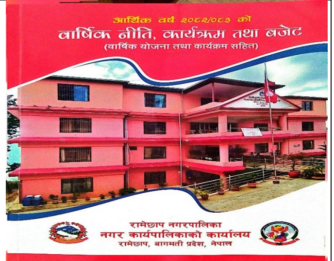
नगरपालिकाबाट सबैको लागि जारी गरिएको वार्षिक नीति, कार्यक्रम, योजना तथा बजेट सम्बन्धी पुस्तिका ।