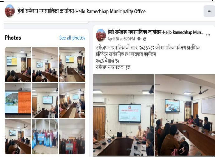
रामेछाप नगरपालिकाले फेसबुक पेजमा राखेको सामाजिक परीक्षणको प्रारम्भिक नतिजा सार्वजनिकीकरण कार्यक्रम ।