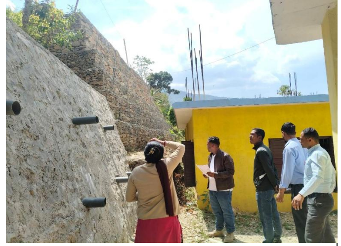
वडा नं ४ मा निर्माण गरिएको रेणुकादेवी मा.वि पहिरो व्यवस्थापन योजनाको सामाजिक प्रभावको विषयमा छलफल गर्दै ।